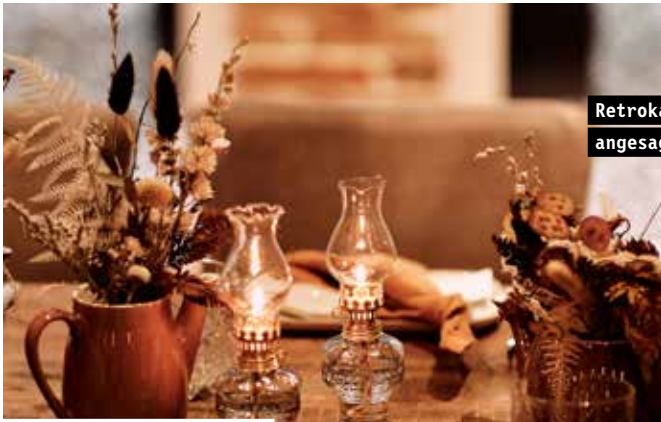
Retrokannen als Vasen für angesagte Vintage Vibes.