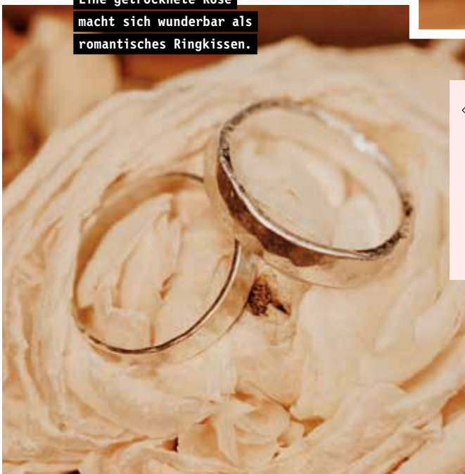
Eine getrocknete Rose macht sich wunderbar als romantisches Ringkissen.

Hängende Blumeninstallationen gehören aktuell zu den beliebtesten Deko-Trends für Hochzeiten. Über dem Tisch des Brautpaares platziert sind die sogenannten Flower Clouds absolute Hingucker. Kombiniert werden die blumigen Wolken mit verzierten Holzringen, die wie hübsche Mobiles über den Köpfen der Gäste schweben.